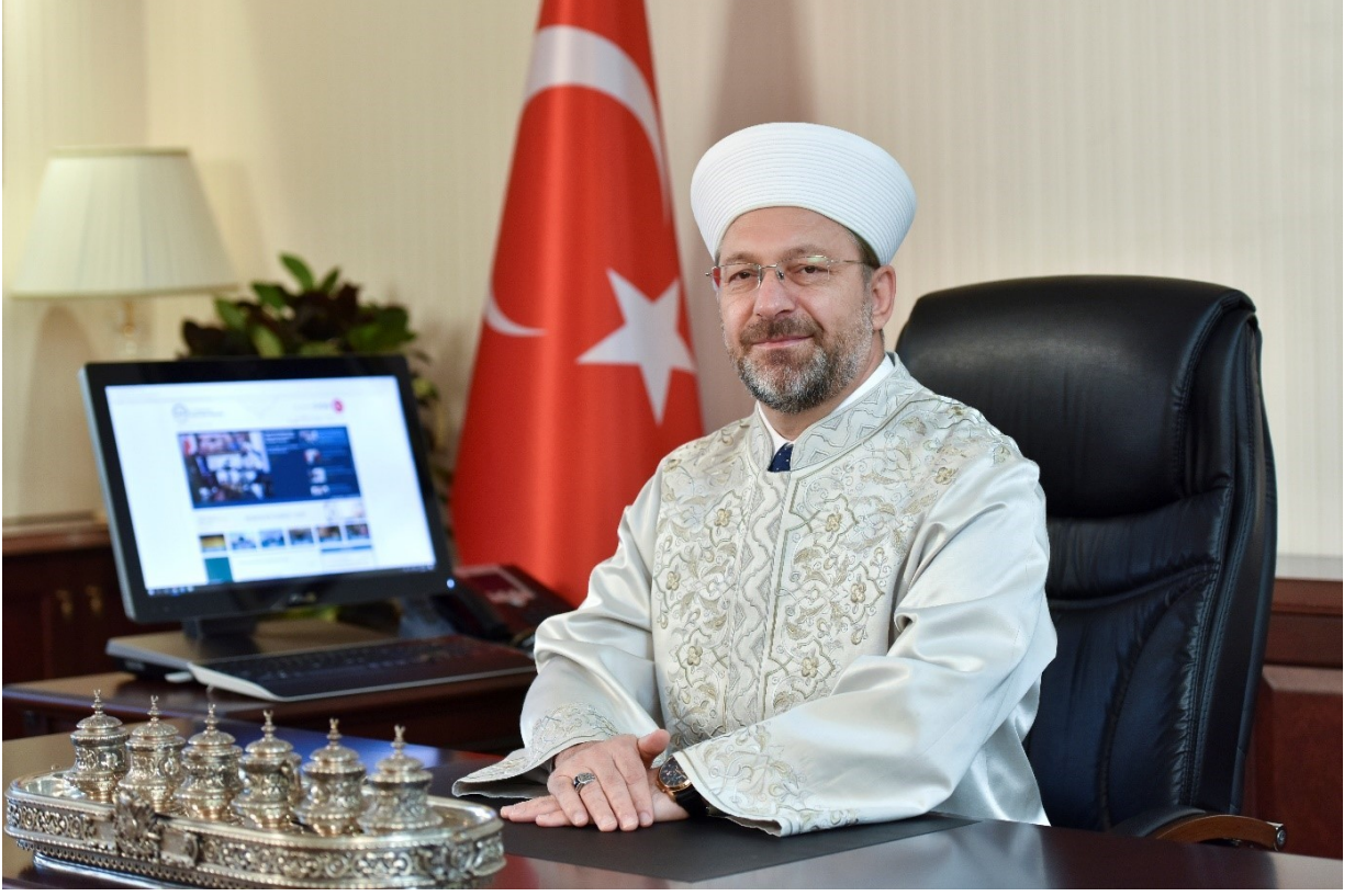
Prof. Dr. Ali ERBAŐ Diyanet İşleri Başkanı